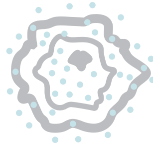
ATAQUE CREA ESTRES OXIDATIVO