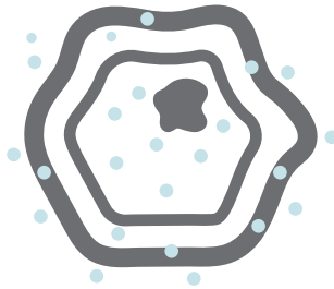
RADICALES LIBRAS ATACAN CELULA